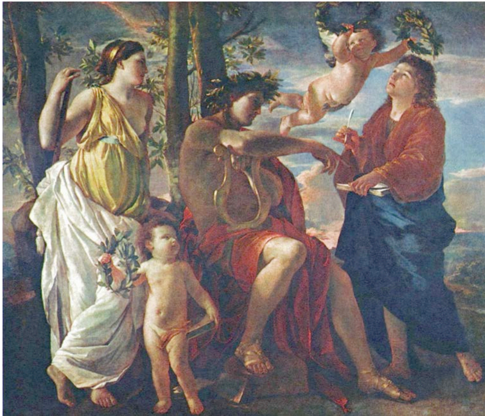
Nicolas Poussin, L'Inspiration du poète (1629) / Huile sur toile, Musée du Louvre, Paris

Universität de Berne / Universität Bern / University of Bern